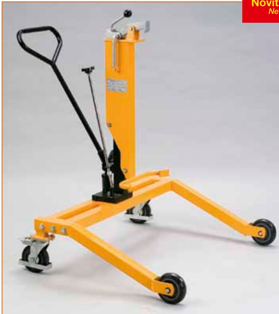
MOD. PF 082/DTHRP Ideale per fusti in acciaio da 210 litri Suitable for full or empty 210 litre steel